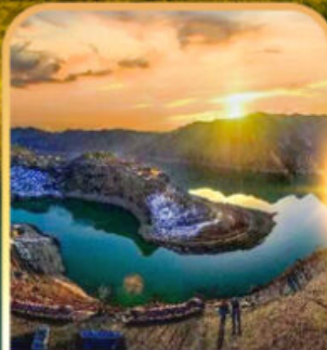
หุบเขาแม่น้ำอวองเหอ