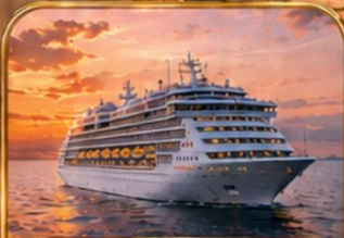
นอนพักบนเรือ 1 คืน