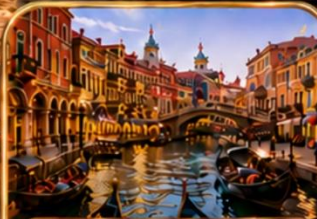
Venice Water Town ต้าเหลียน