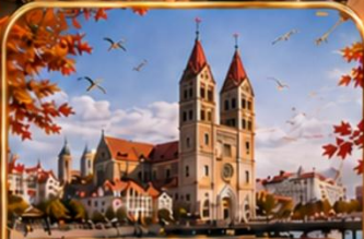
โบสถ์เซนต์ไมเคิล ซิงเต่า