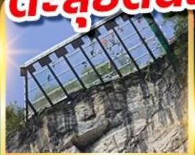
ระเบียงแก้วอุ๋หลง