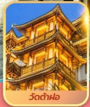
วัดต้าฝอ