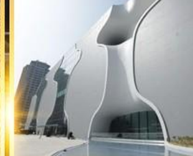
โรงละครโดง