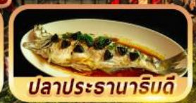
ปลาประรานาริมดี