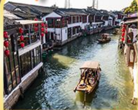
เมืองโบราณจูเจียเจี๋ย