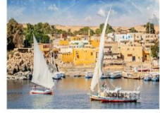
Option ล่องเรือเฟลกะ หรือ ล่องเรือชมหมู่บ้าน Nubian Village

** พักที่ Royal Beau Rivage Nile cruise 5* หรือเทียบเท่า **