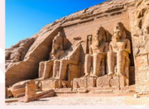
มหาวิหารอาบูซิมเบล