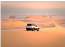
Jeep 4WD สู่ Faiyum

** พักที่ Movenpick Cairo Hotel 5* หรือเทียบเท่า **