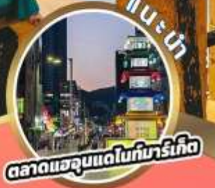
ตลาดแสดยงแดไนท์มาร์เก็ต