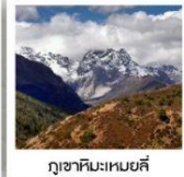
ภูเขาหิมะเหมย์ลี่

“เข้าอุทยานย่าตึง 2 รอบ” 43,999 FREE VISA