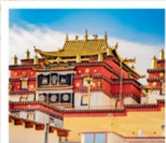
วัดชงจ้านหลิง

คุณหมิง • ยาดิง • เต๋อซิง • แชงกรีสล่า 8 DAYS 7 NIGHTS