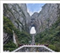
เขาคิยันเหมินชาน