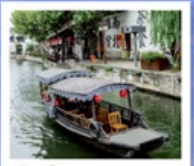
เมืองโบราณหนานสวิน