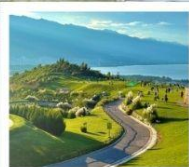
กุขาววินเซียงซาน