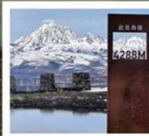
ปาหลางดิงตู