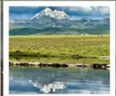
ดวงตาแห่งต่ำทง