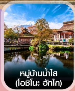
หมู่บ้านน้ำใส (โอชิโนะ ฮักไก)