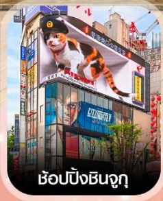
ซ้อปปังชินจูกุ

✈️ คอนเฟิร์ม ออกเดินทาง ทุกพีเรียด 2 ท่านขึ้นไป