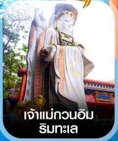
เจ้าแม่กวนอิม ริมทะเล

100% GUARANTEE 100% GUARANTEE การ์ตูนพิศยานข้อปึง