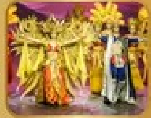
ชมการแสดงโขนจีน