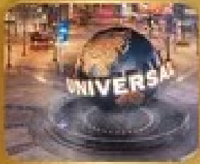
เที่ยวสวนสนุก