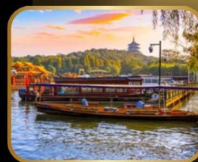
ล่องเรือ ทะเลสาบซีหู