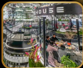
ภัตตาคารชื่อดัง WAREHOUSE NO.3