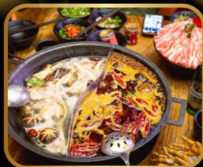
พิเศษ! เมนูหม้อไฟ สุกี้ หม้อไฟสไตล์จีน