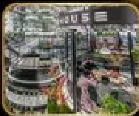
ภัตตาคาร เริ่มต้น WAREHOUSE NO.3