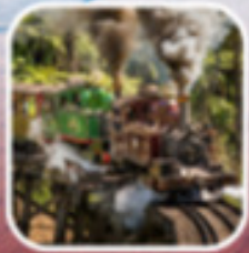
รถไฟจักรไอน้ำโบราน