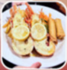
คู่ปลิงปลาดูร์ร้านละ 1 ตัว