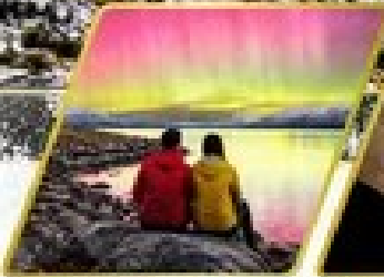
ตามล่าหาแสงใต้