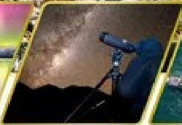
กิจกรรมชมทิวทัศน์ดาว