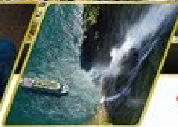
ล่องเรือมิลฟอร์ด ซาวน์