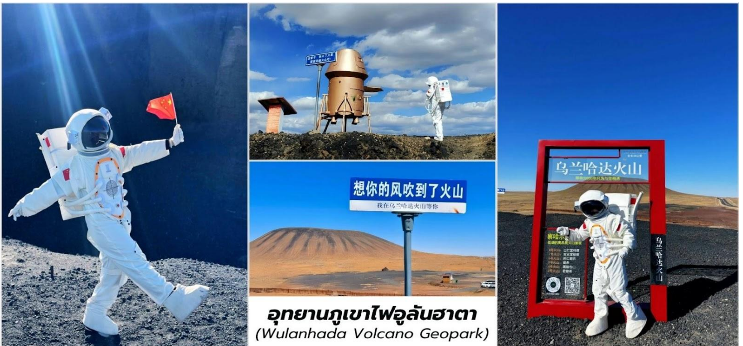
อุทยานภูเขาไฟอูลันฮาตา (Wulanhada Volcano Geopark)

บ่าย จากนั้นนำท่านเดินทางสู่ อุทยานภูเขาไฟอูลันฮาตา (Wulanhada Volcano Geopark, 乌兰哈达火山) ตั้งอยู่ในเขตปกครองตนเองมองโกเลียใน เมืองอูลานชาปู ประเทศจีน เป็นหนึ่งในปรากฏการณ์ทางธรรมชาติที่น่าตื่นตาตื่นใจที่สุด ด้วยลักษณะภูมิประเทศที่คล้ายกับพื้นผิวของดาวอังคาร ทำให้ที่นี่ได้รับฉายาว่า "พิภพภคินีภูเขาไฟธรรมชาติ" และ "ดาวอังคารแห่งมองโกเลียใน" การมาเยือนที่นี่ คุณจะสัมผัสประสบการณ์ที่แปลกใหม่ราวกับการท่องอวกาศกลุ่มภูเขาไฟอูลันฮาตาประกอบด้วยภูเขาไฟที่ดับแล้วกว่า 30 ลูก ที่กระจายตัวอยู่บนทุ่งหญ้า อันกว้างใหญ่