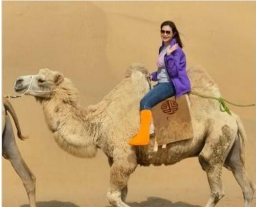
พิเศษ...ขี่อูฐ (รวมค่าขี่อูฐ) สัมผัสประสบการณ์การเดินทางแบบดั้งเดิม