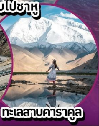
ทะเลสาบคาราคูล

เช็किनไฮไลท์เด็ด น้ำหนักกระเป๋า 20 KG พักโรงแรม 4 ดาว