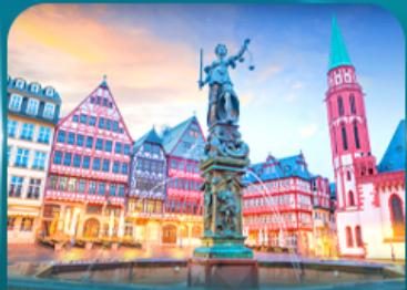
จัตุรัสอิสรเมอร์ แพรงก์เฟิร์ต