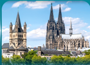
เข็คอินมหาวิหารโคโลญ