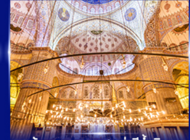
เข้าชมความงามสุเหร่าสีน้ำม้น