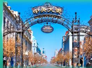
ย่านจงหยาง สตรีท