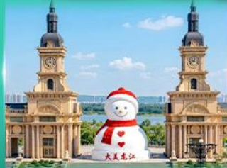
ตึกตาสหิมะยักษ์ ฮาร์บิน