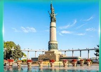
อนุสาวรีย์มังกร