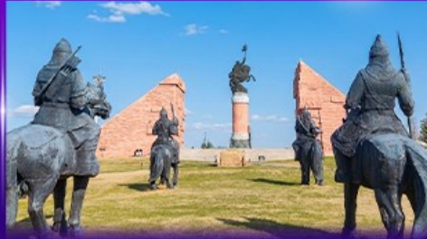
สวนสาธารณะเจงกิสข่าน