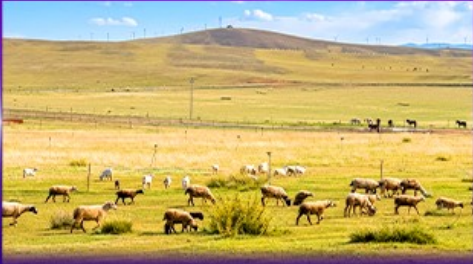
ทุ่งหญ้าซิลามูเหริน