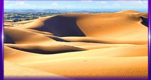
ทะเลทรายอินเคินทาลา