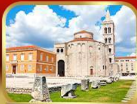
โบสถ์เซนต์โทมัส ซาเกรบ