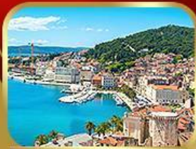
ชมย่านเมืองเก่าสปลิท

14-21 พ.ค. ปรับลดจาก 75,555 18 ที่สุดท้าย 73,333.-