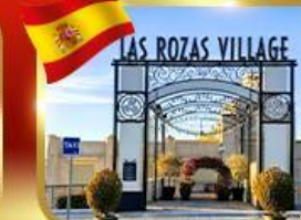
Las Rozas Village เอาก์เลี่ยน