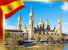
วิหารพระแม่มารีย์ ซาราโกซา