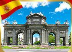
เขikin ประตูอัลกาลา มาดริด