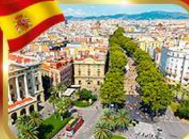
ลารันบลาสตริก บาร์เซโลนา