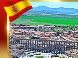
เที่ยวเมืองมรดกโลก เซโกเวีย