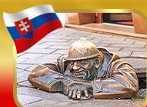
เช็คอินคู่คูมิลเมืองบาติสลาวา