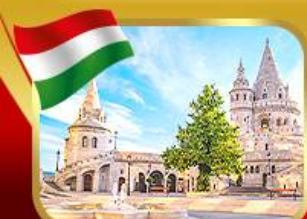
ปิอชชาวประมงเมืองบูดาเปสต์