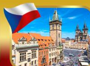
ชมวิวยุทธศาสตร์เมืองปราก