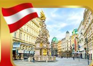
ช้อปปิ้งย่านคาร์ทเนอร์สตรีก