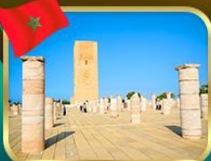
หอคอยฮัสซัน ราบัต