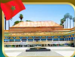
พระราชวังบาเฮีย