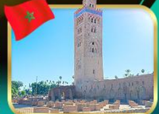
มัสยิดคูตูเบีย มาราเกช