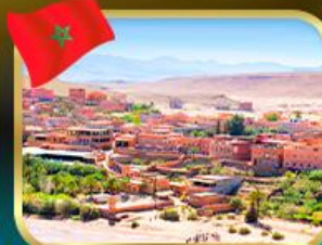
เมืองไค้ เบนฮัดดู