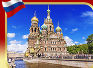
เข็ลอินโบสกแห่งหยดเลือด