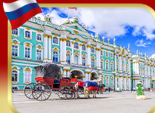
เช่าชมพิพิธภัณฑ์ออร์มิตา