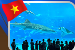
The Sea Shell Aquarium