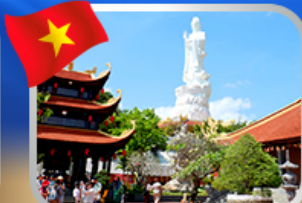
พระโพธิสัตว์กวนอิม วัดโศกวิถ