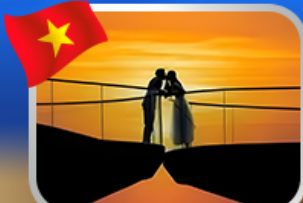
ชมอาทิตย์ตก ณ สะพานงู