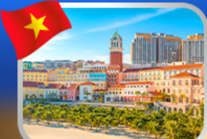
Sunset Town Phu Quoc