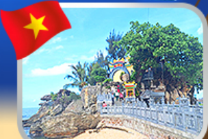
อัคราเรขอพราสาทเจ้าติงเกา