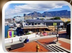
ช้อปปิ้งท่าเรือแบรนด์ชั้นนำ V&A waterfront