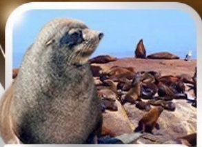
ล่องเรือชมฝูงแมวน้ำ ณ Seal Island

ทะเลชายฝั่ง อุทยานสัตว์ป่าหุบเขาพิลานเนเบิร์ก