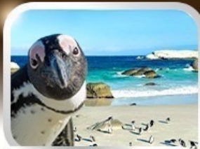
Simon's Town ชมนกเพนกวินสุดน่ารัก