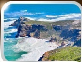
ชมวิวยอดนิยมแอฟริกา cape of good hope