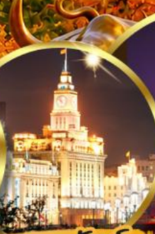
เดอะมันด์