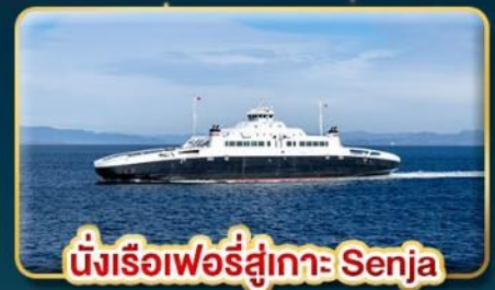
นั่งเรือเฟอร์รี่สู่เกาะ Senja