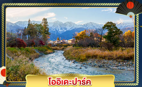
โออิเดะปาร์ค