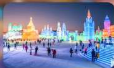
เทศกาลน้ำแข็งฮาร์บิน