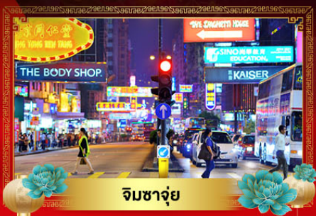
จิมซาจุ่ย