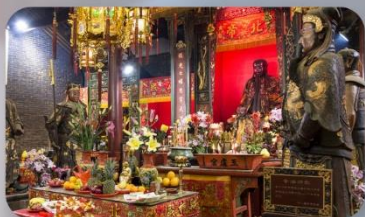
วัดปักไต้

THE LUXE MANOR HOTEL หรือเทียบเท่า 4-5 ดาว