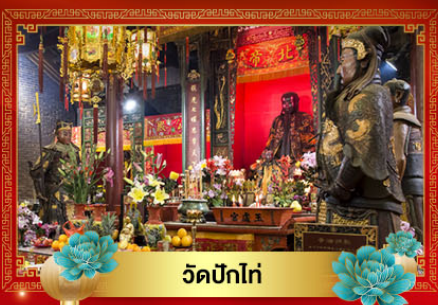
วัดปึกโท่