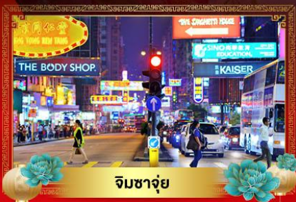
จิมซาจ๋วย