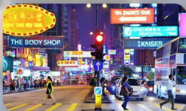
จิมซาจู้