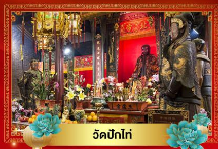
วัดปึกโท