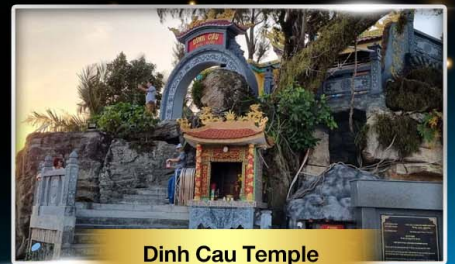
Dinh Cau Temple