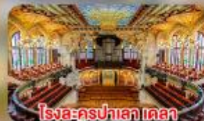
โรงละครปาลาเดอเดลา มูสิคก้า คาตาลานา