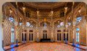
Palácio the Bolsa