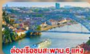
ส่องเรือชมสะพาน 6 แห่ง ในคูเมืองปอร์โต