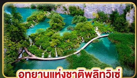
อุทยานแห่งชาติพลิตวิเช