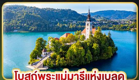
โบสถ์พระแม่มาเรียแห่งบลัด