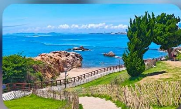
เกาะสี่เหลี่ยมเต่า