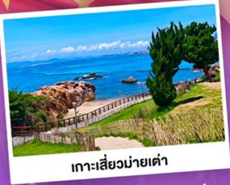
เกาะเสี่ยวมายเต่า

เที่ยวชิงเต่า เมืองทะเลสุดชิล ครบทั้งกิน เที่ยว ถ่ายรูป