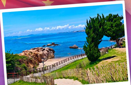
เกาะเสี่ยวมายเต่า

เที่ยวชิงเต่า เมืองทะเลสุดชิล ครบทั้งกิน เที่ยว ถ่ายรูป