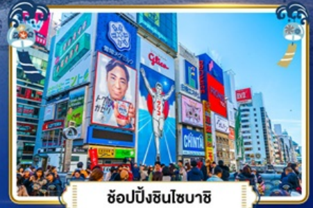
ช้อปปิ้งชินโซบาช