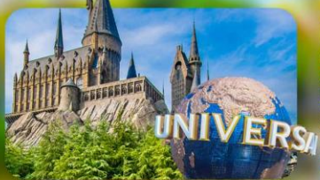
เลือกอิสระ Universal Studios Japan