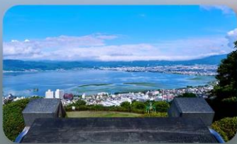
ทะเลสาบสุวะ