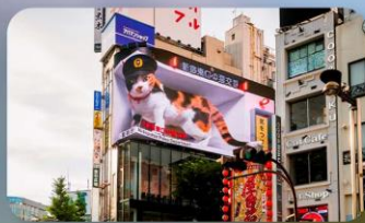
ช้อปปิ้งชินจุกุ