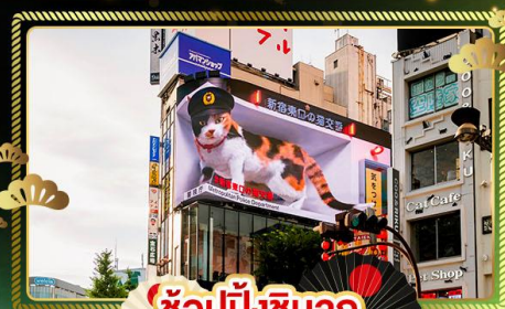
ช้อปปิ้งซินจูกุ