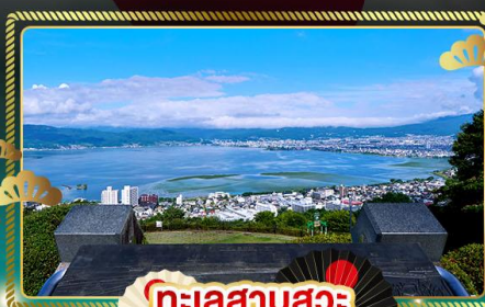
ทะเลสาบสุวะ

เส้นทางธรรมชาติ จุดชมวิวกาเบเนออลปี เที่ยวครบ ใช้รถทุกวัน ไม่มีวันเอ๊าสิระ