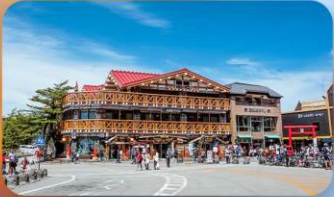
ภูเขาไฟฟูจิ ชั้นที่ 5