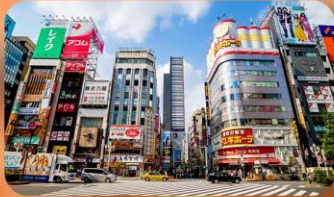
ซ้อปปิ้งชินจูกุ