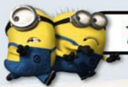
ZONE 5 : THE LOST WORLD