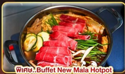
พิเศษ.. Buffet New Mala Hotpot Free Flow Beer & Soft Drink