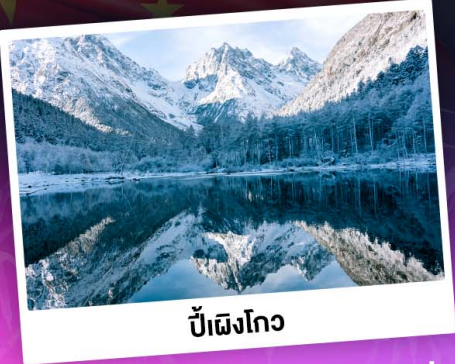
ป่าเผิงโกว

ท่องเขาแอลป์เมืองจีน "ภูเขาสี่ดรุณี" ชมความสวยงามของอุทยานป่าเผิงโกว