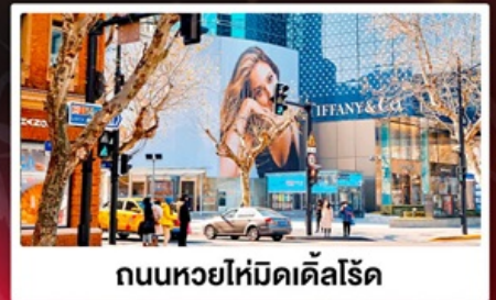
ถนนหวยไห่มีดเคิลโรด